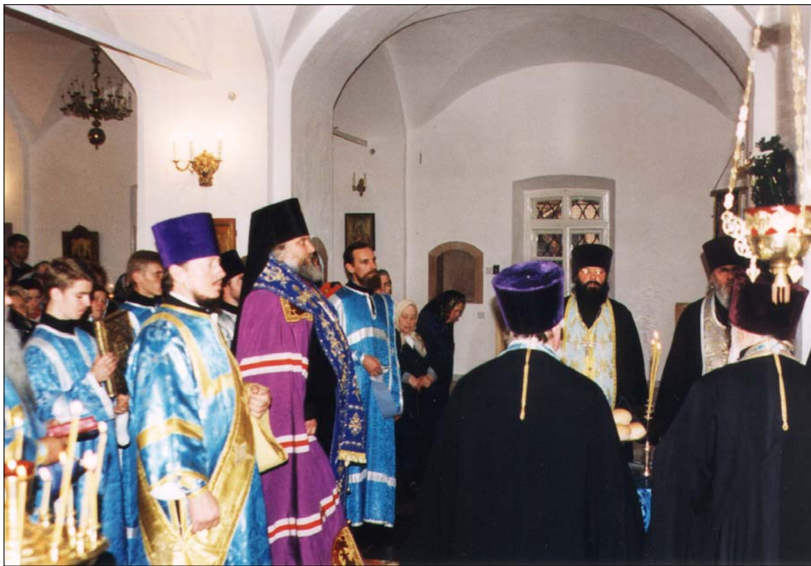
Престольный праздник Покрова Пресвятой Богородицы. Богослужение совершает архиепископ Истринский Арсений (Епифанов), 1999 г.