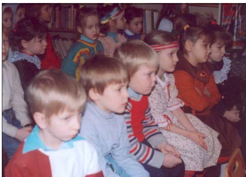
Дети воскресной школы на Рождественском спектакле.

Так, в 1994 году с шестилетними детьми мы поехали в нашу первую паломническую поездку в Андроников монас-