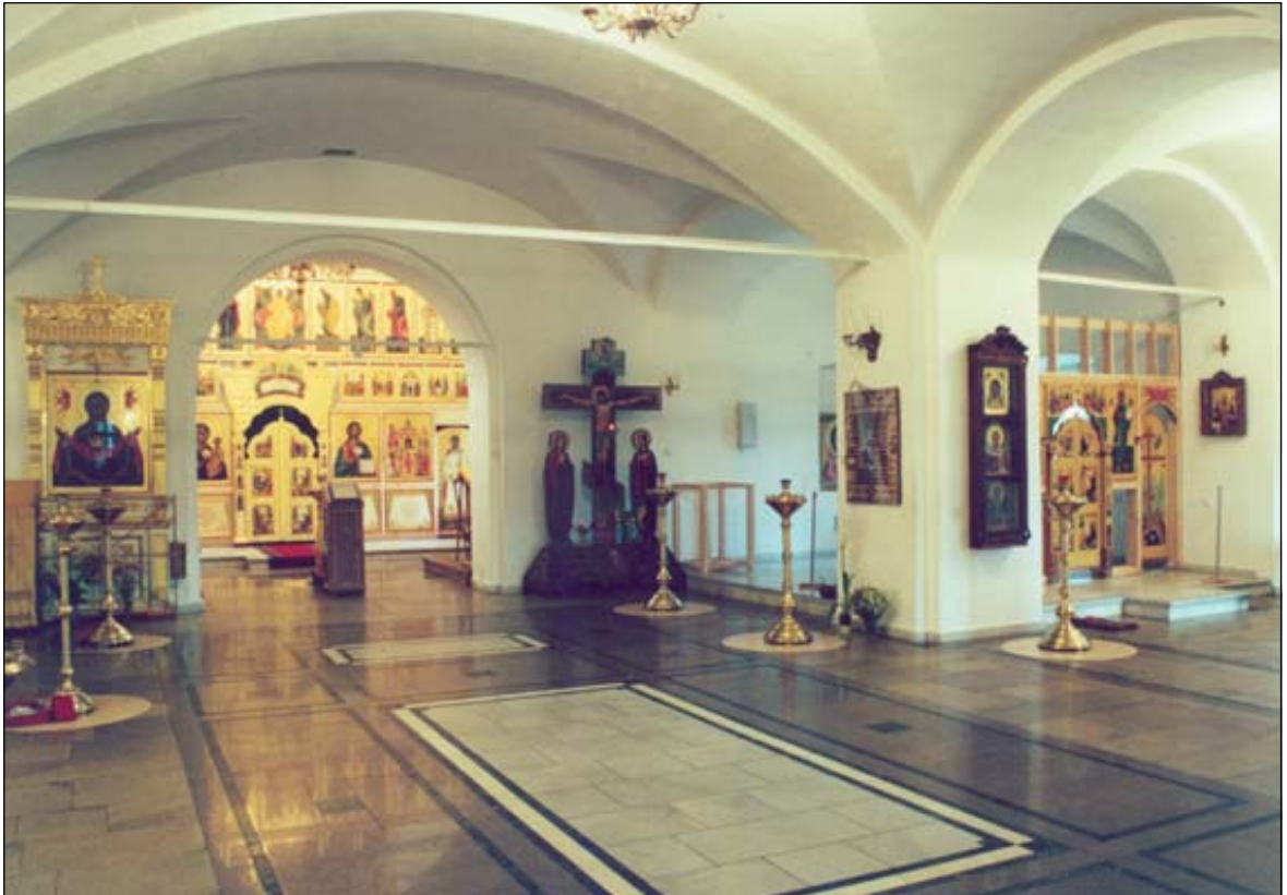
Возведение иконостаса в приделе Святителя Николая, 2002 г.