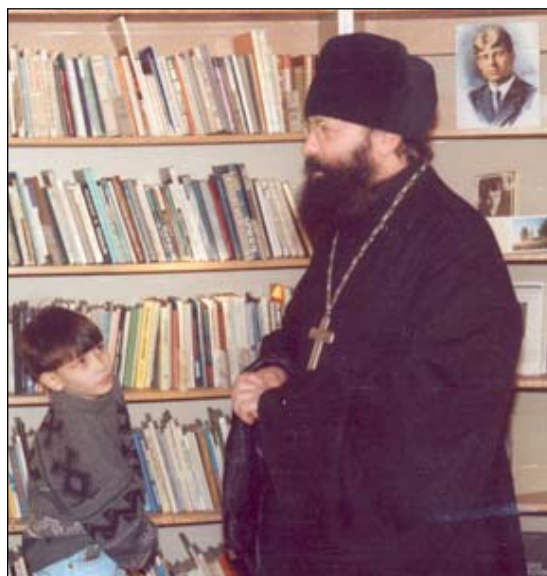
Встреча учащихся воскресной школы с батюшкой в детской библиотеке № 153, 1993 г.

Поэтому в нашей школе мы отмечаем большие церковные праздники православными спектаклями, играми и чаепитием.