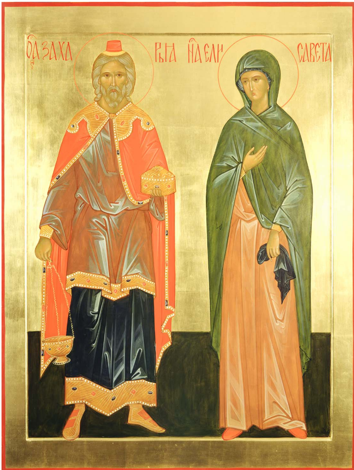
Икона Святых и праведных Захарии и Елисаветы (левый придел храма Покрова)