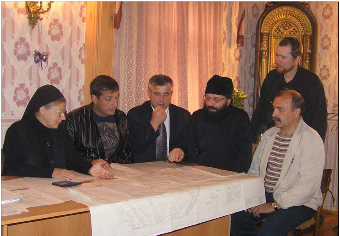
Обсуждение проекта строительства православной гимназии, 2004 г.