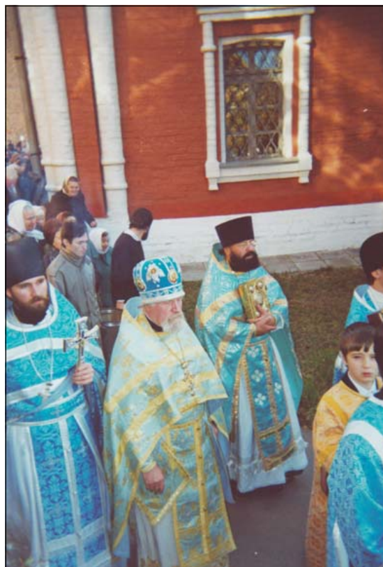
Крестный ход в престольный праздник Покрова Пресвятой Богородицы, 2002 г.

Создание Духовно-культурного центра при храме Покрова на Городне вызвано желанием возродить духовные ценности в сердцах нового поколения, помочь ему воспринять и усвоить богатство духовного опыта нашей Церкви, привить ему благоговение к окружающему миру и любовь к творческой деятельности, помочь найти свое место в жизни. Поэтому программа Центра предполагает в первую очередь открытие православной гимназии, которая имела бы государственную лицензию на общеобразовательную деятельность. Нам хотелось бы