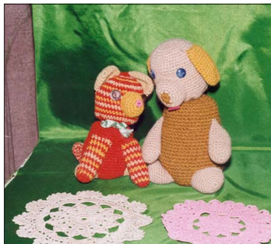
Мягкие игрушки, сделанные нашими учениками.

Помимо занятий с детьми преподаватели проводят занятия для взрослых, которые могут посещать и учащиеся 10–11 классов.