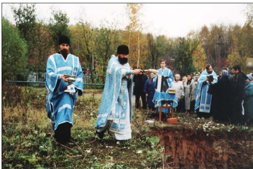
Освящение котлована под фундамент часовни во имя Преподобного Сергия Саровского на Покровском кладбище, 2002 г.

В наших планах — не только восстановление кладбища, которое было когда-то при церкви Покрова на Городне, но и строительство там часовни. Наш святой долг — возродить память о предках, поруганных и забытых нами.