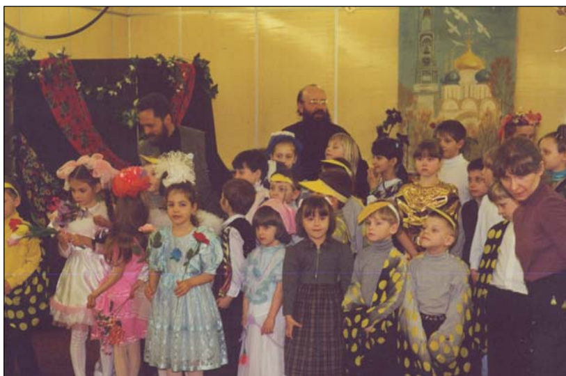
Детский праздник в доме культуры «Виктория».

и их родителей устраивается чаепитие с блинами, по окончании которого на территории возле нашего храма дети участвуют в зимних играх: катаются с горки, которую специально для них подготавливают работники храма, водят хороводы, ездят верхом на лошади.