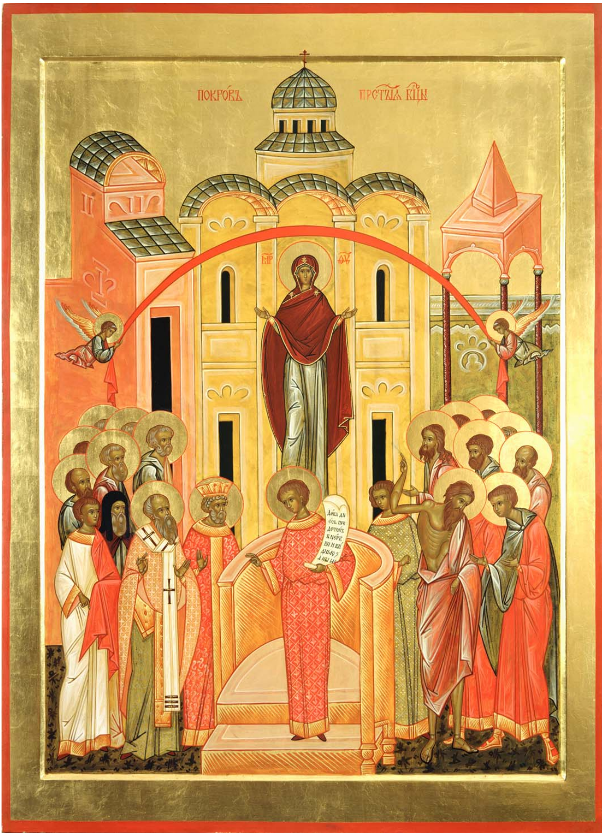
Храмова икона Покрова Пресвятой Богородицы