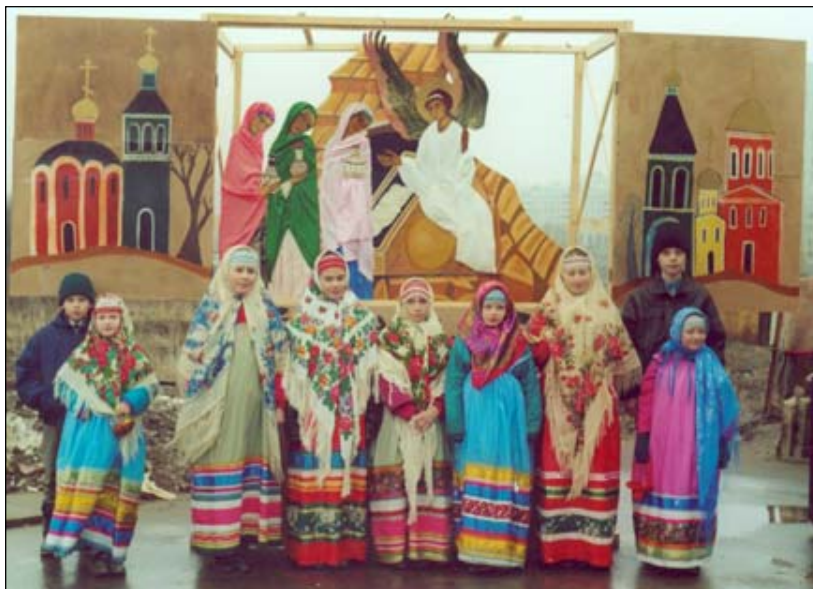
Выступление детей на празднике Пасхи.

жали» на занятия в нашу школу, так они им нравились. Родителям было предложено регулярно приводить малышей ко святому Причастию. И хотя многие семьи были в то время нецерковными, большинство родителей приводило детей причащаться, а потом они сами отмечали, насколько благотворно это действует на их ребенка. Некрещенные дети сами попросили о том, чтобы их окрестили. Многие родители пришли вслед за своими детьми в Церковь. Все это очень отраднo и утешительно.