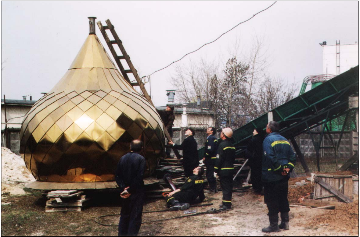
Подготовка главы храма-часовни к установке, 2002 г.