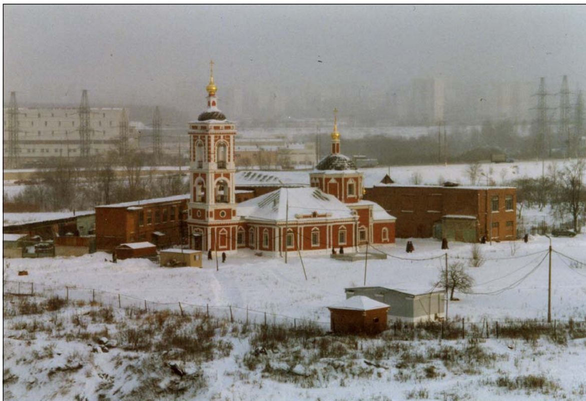
Церковь Покрова Пресвятой Богородицы на Городне, 2004 г.