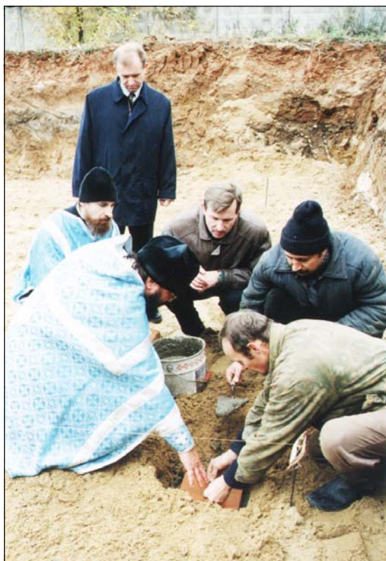
Закладка камня в основание храма-часовни, 2002 г.

Дальнейшие перспективы развития Центра не ограничиваются только этими планами. Дело в том, что Чертановский район Южного Округа населен достаточно плотно, и мы надеемся, что придет то время, когда новое поколение найдет дорогу к Богу, и тогда уже наш храм, который вмещает не более 350 человек, будет мал для всех, желающих принять участие в богослужении. Поэтому в перспективе хо-