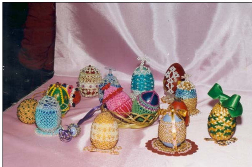
Пасхальные яйца, украшенные бисером. Подарок наших детей к празднику.

В субботу на Масляной неделе для учащихся нашей Воскресной школы