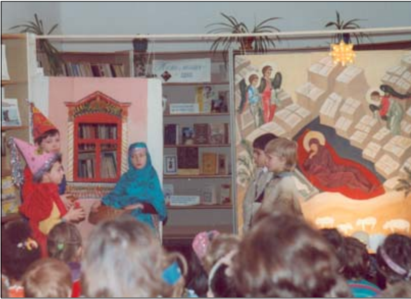
Рождественский спектакль в Детской библиотеке № 153.