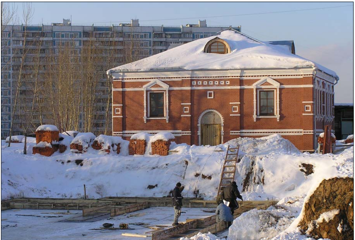
Строительство православной гимназии и дома причта, 2006 г.